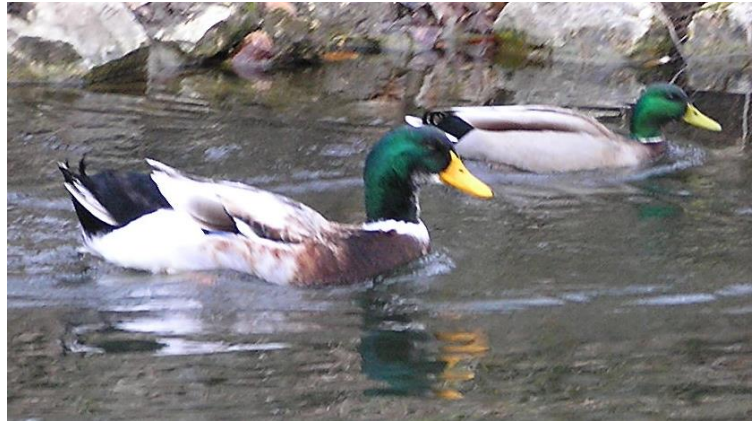
Foto: In städtischen Gewässern verpaaren sich die Stockenten häufig mit ausgesetzten Hausentenrassen und man findet seltsame Hybride – vorne z.B. ein Erpel in den Farben einer echten Stockente (dahinter), aber er wirkt wie aufgepumpt und die Farben erscheinen übertrieben.

Der Winter war wieder sehr mild, und wie im vorigen Jahr gab es im Park keine seltenen Wintergäste. Sie sind wohl noch weit auf den umliegenden Gewässern verteilt und finden dort ihr Auskommen.