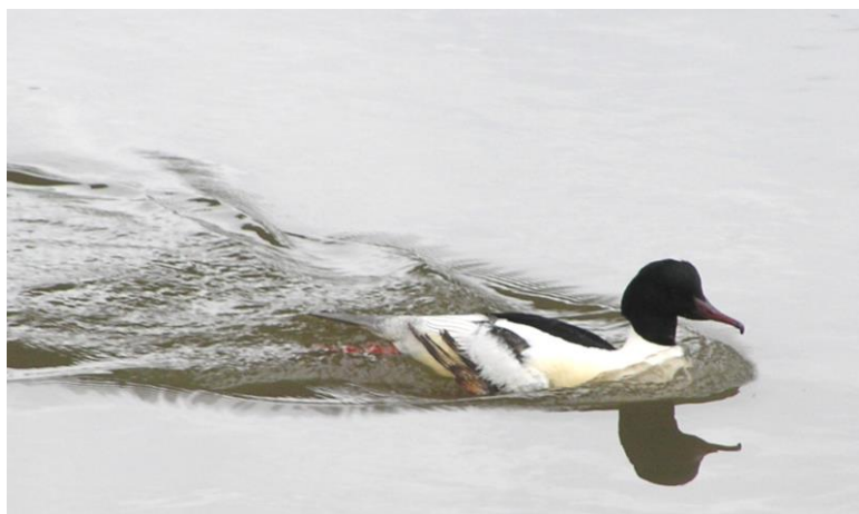
Dieses Gänsesäger-Männchen mochte nicht fotografiert werden und schwamm mit schäumenden Kielwasser in Deckung.