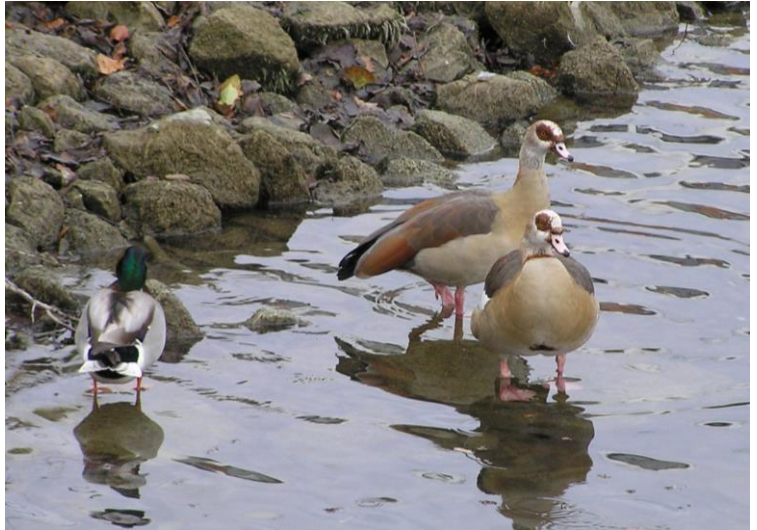
Foto: Ein Hauch von Afrika liegt über der Friedrichsau: Hier treiben sich verwilderte Nilgänse herum.

Nach mehreren Nebelwochen war die Sicht jetzt wieder frei, aber es war bewölkt und windig bei Temperaturen um 5°C. Gelegentlich stäubten ein paar Regentropfen vom Himmel.