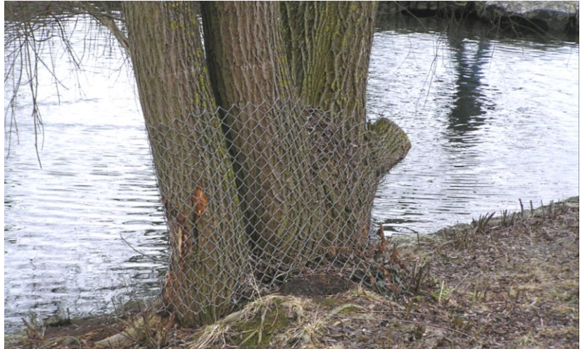
Foto: An den Auseen kommen Biber vor. Viele Bäume werden mit Maschendrahtmanschetten vor ihnen geschützt.

Es war bedeckt, aber trocken und fast windstill, und mit etwa 6° nicht besonders kalt. Der Winter lässt in diesem Jahr auf sich warten, und daher suchten den Stadtpark bisher auch keine seltenen Wintergäste auf. Sie sind wohl noch weit auf den umliegenden Gewässern verteilt und finden dort ihr Auskommen.