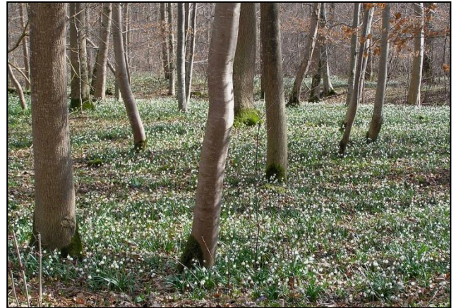
Foto: Im März überzieht ein Teppich aus Märzenbechern den Boden des Auwalds.

27. Februar 2011 , 9:00 –12:45 Uhr, 15 Personen