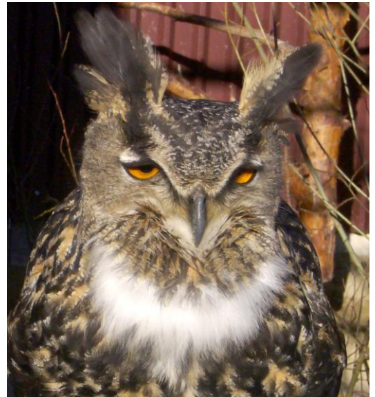
Foto: Dieser Uhu (in der NABU-Vogelpflegestation Mössingen) lässt gerade seinen Balzruf ertönen. Dabei bläht sich die Kehle und unter dem Deckgefieder werden weiße Daunen sichtbar.

Trotzdem hatten wir unsere Sensation. Wenn man auch weiß, dass Uhus und Wanderfalken in unserer Region fast jeden geeigneten Steinbruch besiedeln – wann sieht man die schon? Hier jedoch sichteten wir tatsächlich einen ausgewachsenen Jung-Uhu, der in einem Baum am Steinbruch saß und mit dem Spektiv detailgenau zu bewundern war. Auch schön, aber wegen des schlechten Wetters nur auf Distanz zu hören waren die Bienenfresser, die im Steinbruch nisten.